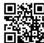
ホームページ QR コード