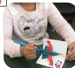
ポップアップカード

クリスマスのポップアップカードには子ども達が好きなメッセージや絵を描いていました(^o^)/