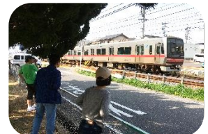
公園から見える瀬戸電 も大好きです