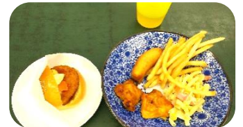
手作りのバイキング